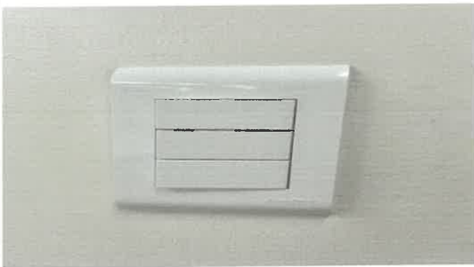
지하1층 아지트 3구 전등스위치 교체