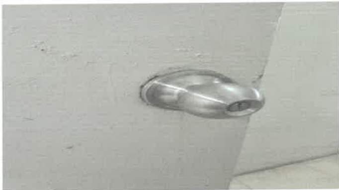
지하1층 비트출입 방화문 도어락 교체