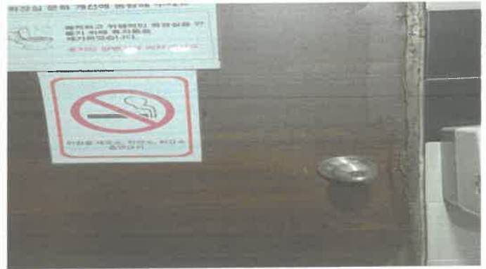
수영장 내 위험물저장소 도어락 교체